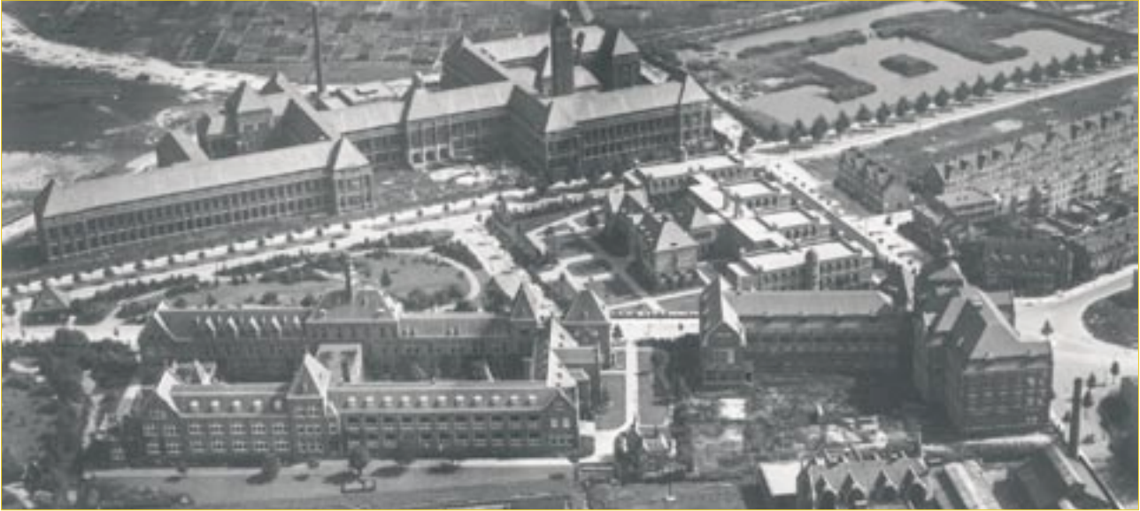
Luchtfoto 1925: linksboven het huidige BK-city gebouw