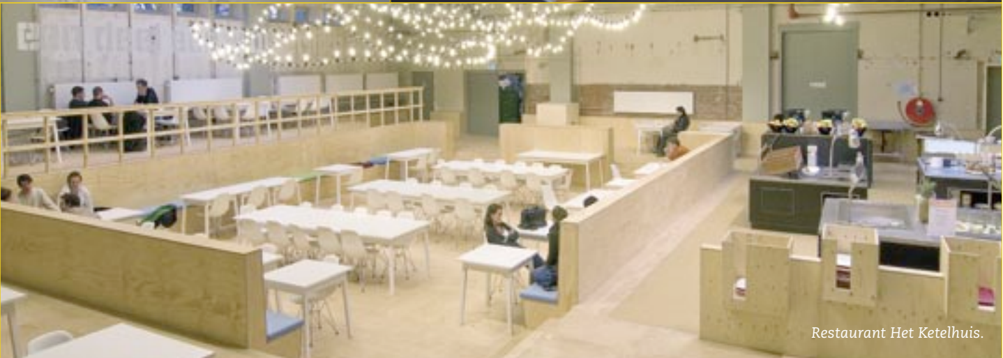
Restaurant Het Ketelhuis.

espresso bar Sterk – een object van 2012 architecten – wordt de cradle-to-cradle-filosofie geïllustreerd.