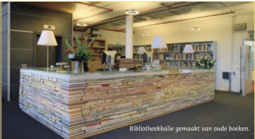
Bibliotheekbalie gemaakt van oude boeken.